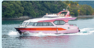
おおさき 旅客定員/80名 設備/冷暖房・トイレ