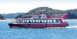
おくしま 旅客定員/80名 設備/冷暖房・トイレ