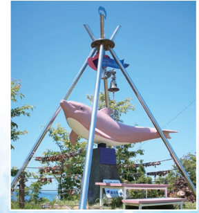
행복을 부르는 핑크 돌고래