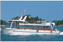
미츠시마 정원 85명 선내설비 / 병난방 · Free Wi-Fi · 화장실