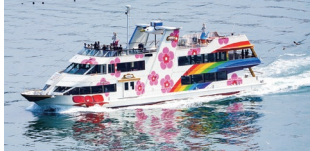
플라워 메어maid 정원 360명 선내설비 / 병난방 · Free Wi-Fi · 카페 · 화장실