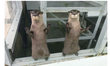
수달 (린 & 란)