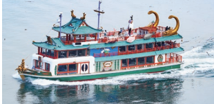
류구성 정원 360명 선내설비 / 병난방 · Free Wi-Fi · 카페 · 화장실

※4세 미만의 유아는 어른1명에 대해서 1명 무료입니다. ※15명 이상은 단체 할인됩니다.